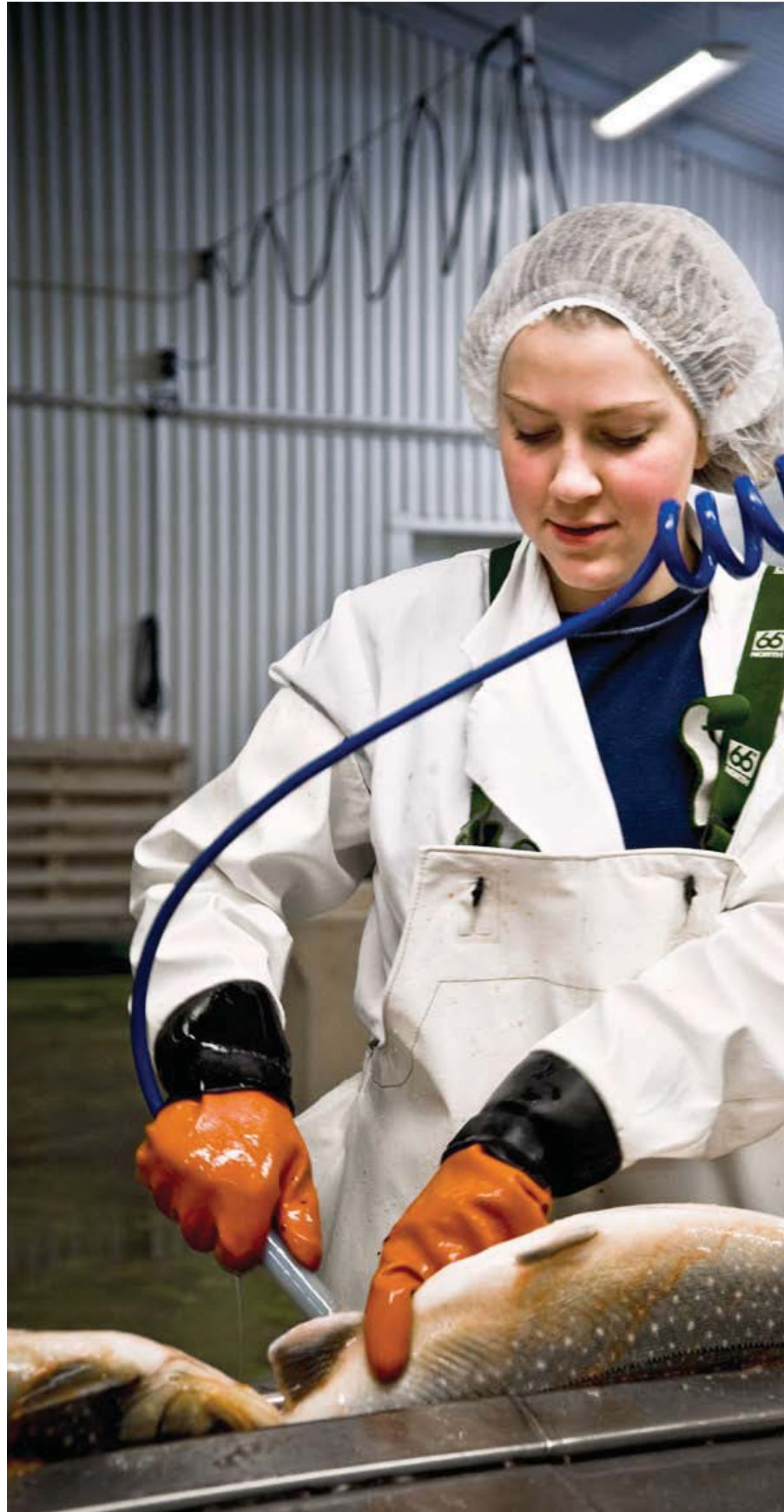
Eldisbleikja slægð í Silfurstjörnunni.