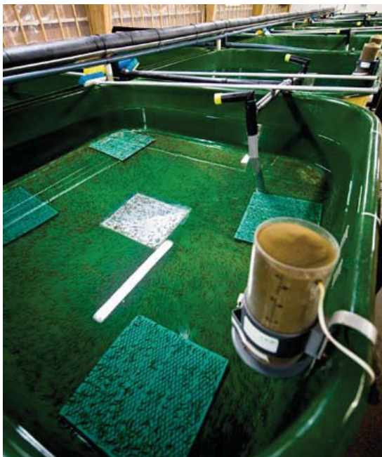
Seiðaeldi hjá Íslandslaxi.

Sé reiknað með um 10% aukningu á ári næsta áratug, eins og gert er í stefnumótun Landssambands fiskeldisstöðva, þá má ætla að framleiðsla á eldisbleikju verði komin í um 9 þúsund tonn árið 2020.