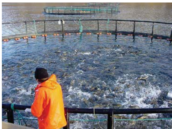
Þorskeldi í sjókvímum fyrir vestan.